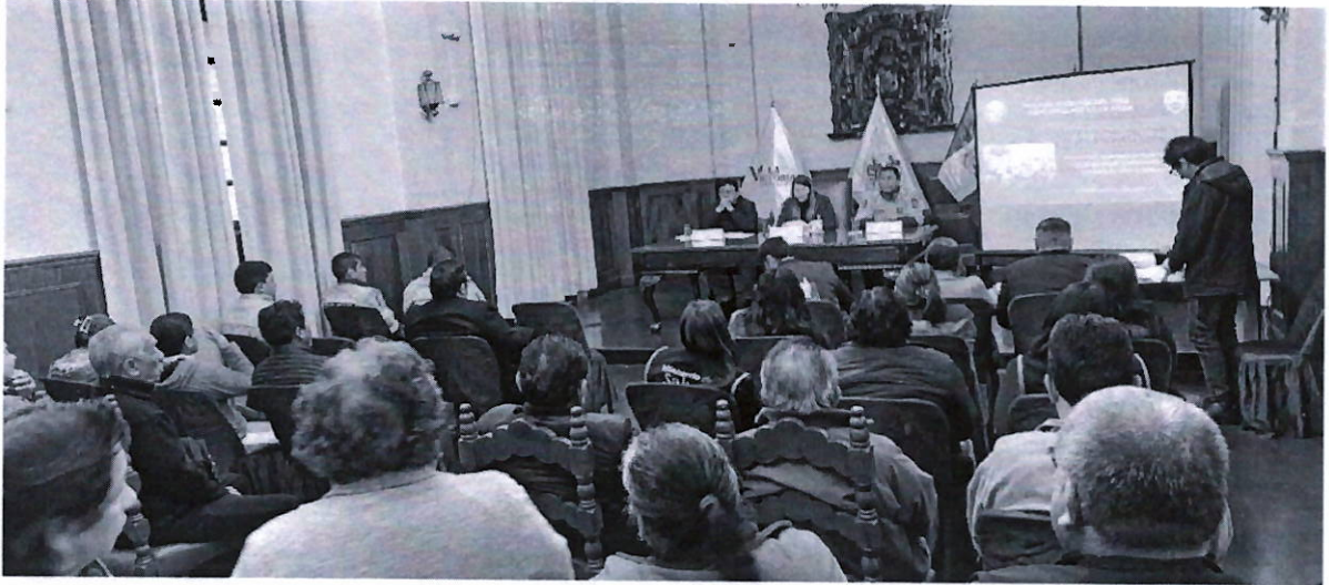
Fotografía 2: "2da. Consulta Pública del 2024 del CODISEC LA VICTORIA"